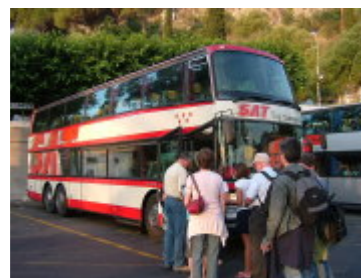
バスターミナルからの出発風景

タオルミーナ最大のバス会社 SAT 社で、タオルミーナ発バスツアーを催行しています。