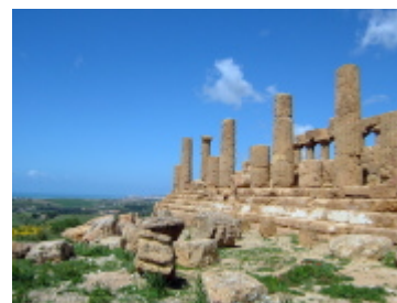
アグリジェント神殿の谷

シチリア島内陸部を横断し、南の海岸線にあるアグリジェントへ。紀元前6世紀～5世紀のギリシャ神殿群が丘の上に立ち並ぶ神殿の谷を見学します。その後、アグリジェントの海沿いのレストラン兼パールにて、昼食のためのフリータイム。フリータイム終了後、内陸部に位置するピアッツァ・アルメリーナへ。3～4世紀のローマ時代の床モザイクで有名なカザーレ別荘跡を訪れます。見学終了後、タオルミーナに戻ります。