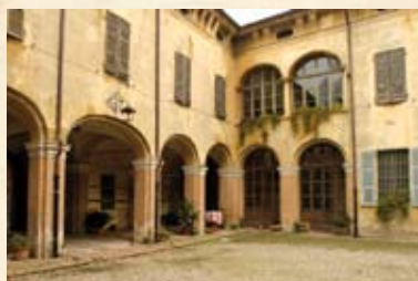
Palazzo e parco Barattieri a San Pietro in Cerro

Centro termale di Salsomaggiore e Tabiano Comune di Salsomaggiore Tel. 0524.580211