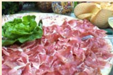
Zona di produzione del culatello - Roccabianca