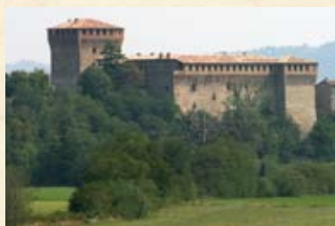
Castello di Varano de' Melegari