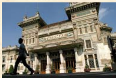
Terme Berzieri di Salsomaggiore