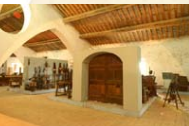
Aranciaia di Colorno

Zona di produzione del Salame di Felino Comune di Felino Tel. 0521.335920