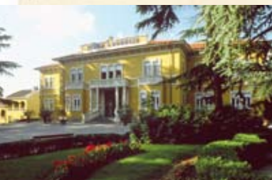
Stabilimento termale di Monticelli

Zona di produzione del culatello Comune di Roccabianca Tel. 0521.876165