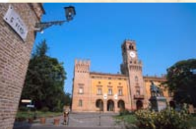
Piazza G. Verdi di Busseto