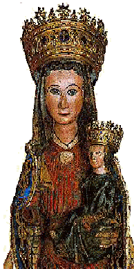
Santuario Madonna di Crea